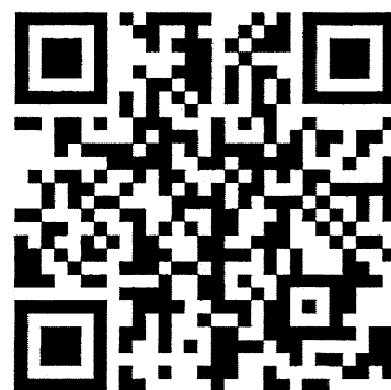
新規登録 QR コード